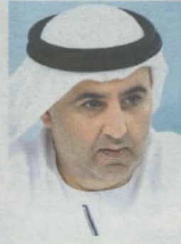
«لجان التحكيم قامت بجهود كبيرة لتقييم العناوين المرشحة في الدورة التاسعة بدقّة وشفافية متناهية.»

للكتاب اللبناني حسن العبدالله، من منشورات دار الآداب للصغار بيروت/لبنان 2013. أما فرع المؤلف الشاب فشمّل «حركيّة البديع في الخطاب الشعري؛ من التحسين إلى التكوين» للباحث المغربي د. سعيد العوادي، كنوز للعرفة بالأردن 2013، و«منزلة التمثيل في فلسفة